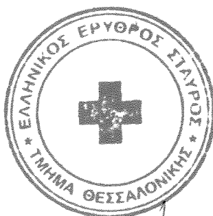
ΔΗΜΗΤΡΑ ΧΑΤΖΗΠΑΥΛΟΥ ΛΙΤΙΝΑ